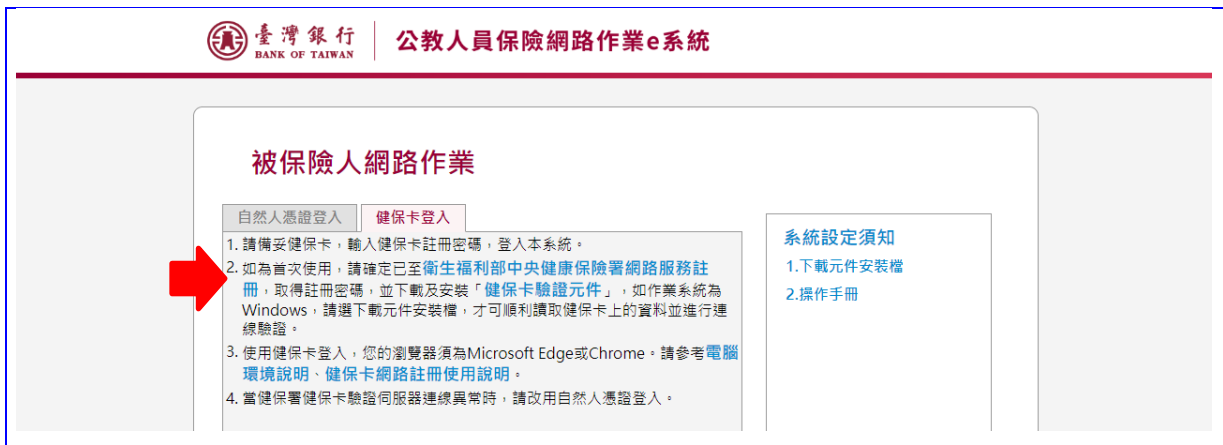
【圖 2-5】e 系統被保險人網路作業-健保卡登入畫面

首次使用健保卡網路服務須先連線至衛生福利部中央健康保險署「健保卡網路服務註冊」下載安裝健保卡驗證元件，以及完成註冊申請並設定密碼。操作方式請詳該服務網站→系統設定須知之「健保卡網路服務註冊使用說明」。