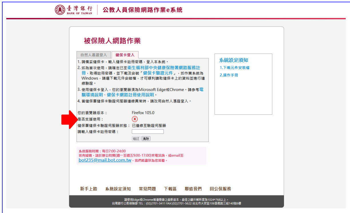
【圖 2-11】e 系統被保險人網路作業-健保卡登入失敗畫面

如健保卡驗證伺服器連線失敗，可能為健保卡驗證元件未成功安裝或瀏覽器版本不符等情形，請重新安裝驗證元件或改用瀏覽器重新連線登入。若健保卡驗證伺服器狀態異常時，請改用自然人憑證登入。