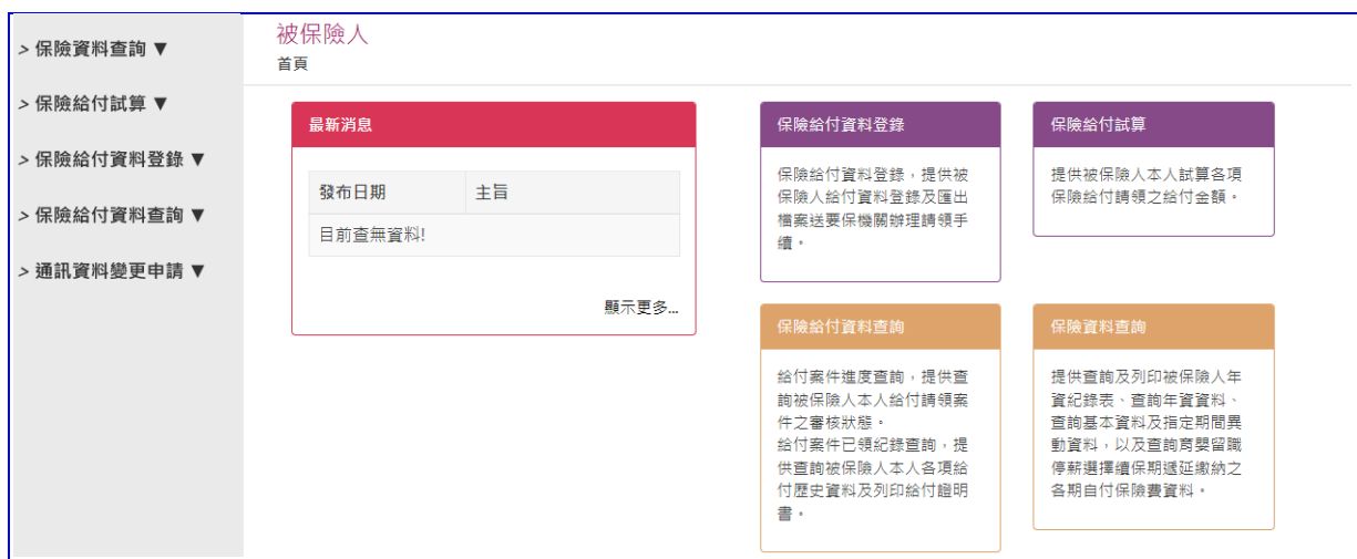
【圖 2-12】e 系統被保險人網路作業-登入成功畫面