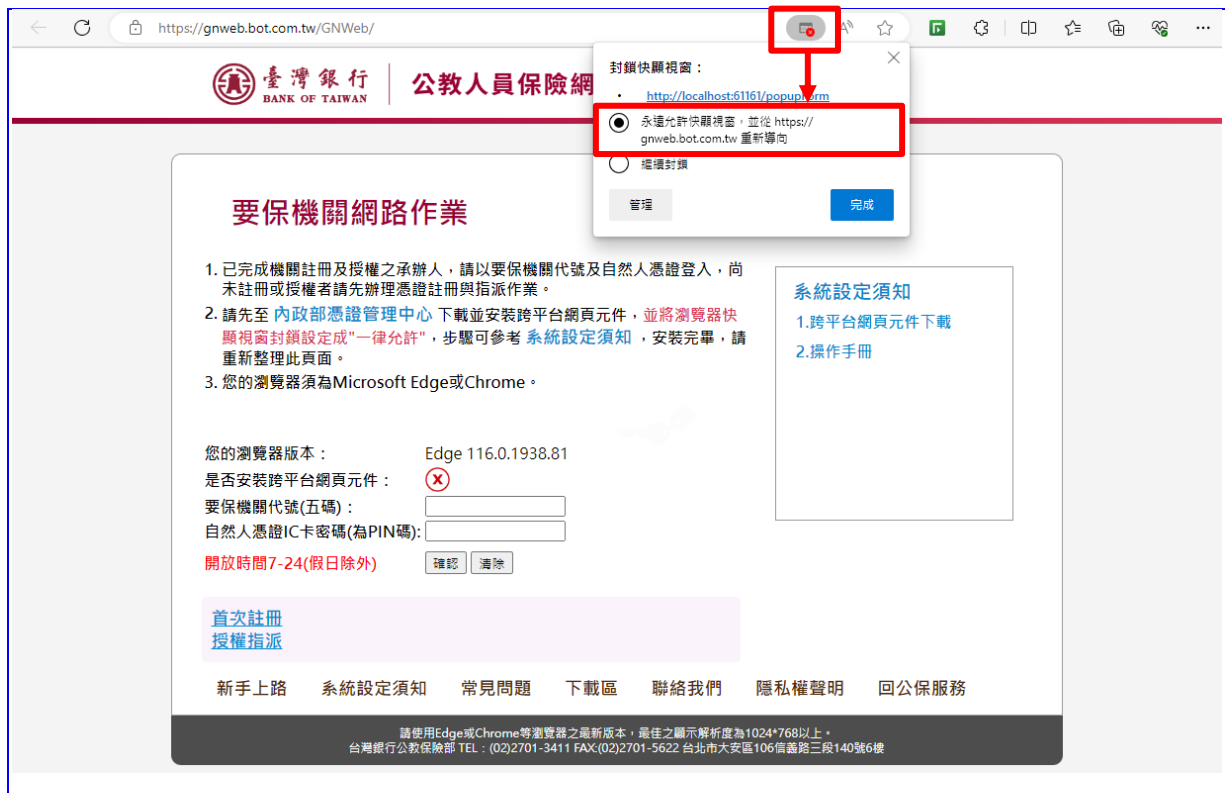
【圖 2-1】Edge 瀏覽器設定擴充功能步驟畫面

將瀏覽器快顯視窗封鎖設定成「永遠允許快顯視窗，並從 https://gnweb.bot.com.tw 重新導向」。