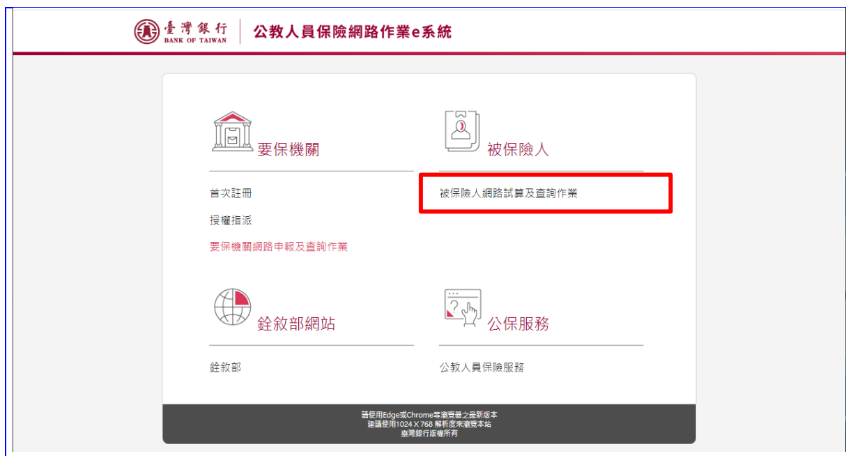
【圖 2-8】公保網路作業 e 系統首頁畫面