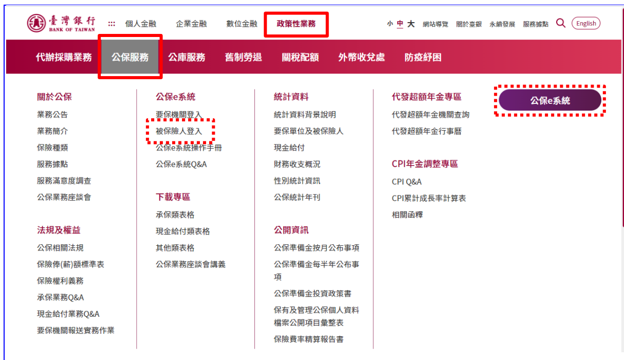
【圖 2-7】臺灣銀行全球資訊網公保服務選單畫面