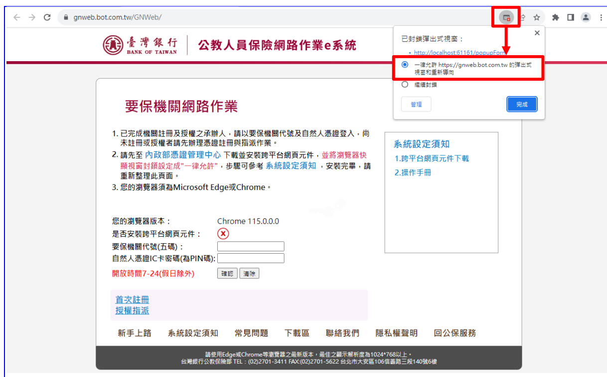
【圖 2-2】Chrome 瀏覽器設定擴充功能步驟畫面

將瀏覽器快顯視窗封鎖設定成「一律允許 https://gnweb.bo t.com.tw 的彈出式視窗和重新導向」。