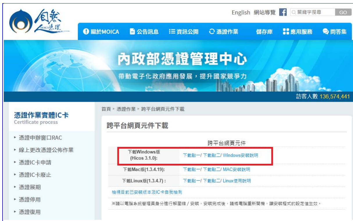
【圖 2-3】內政部憑證管理中心元件下載畫面