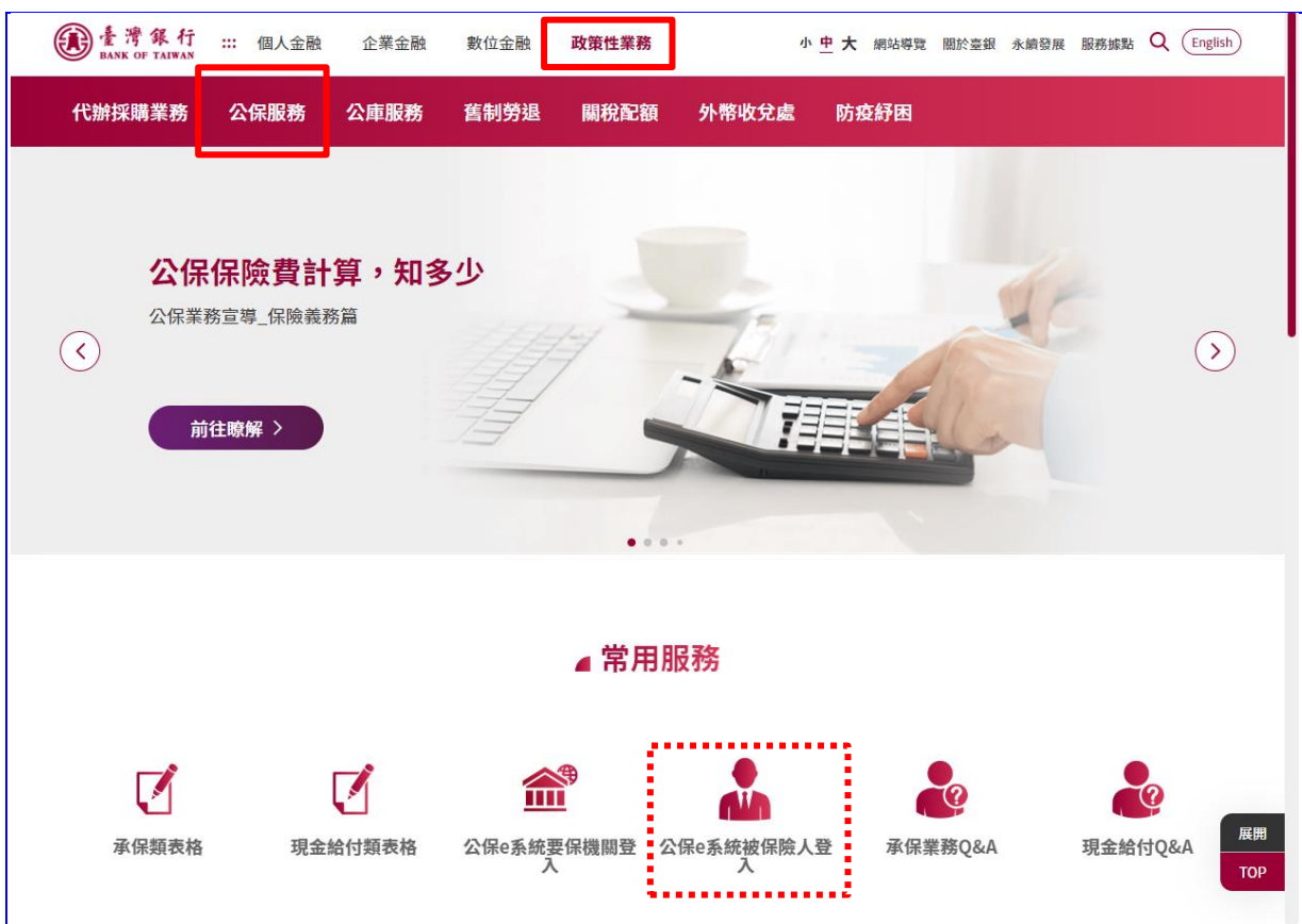
【圖 2-6】臺灣銀行全球資訊網公保服務畫面